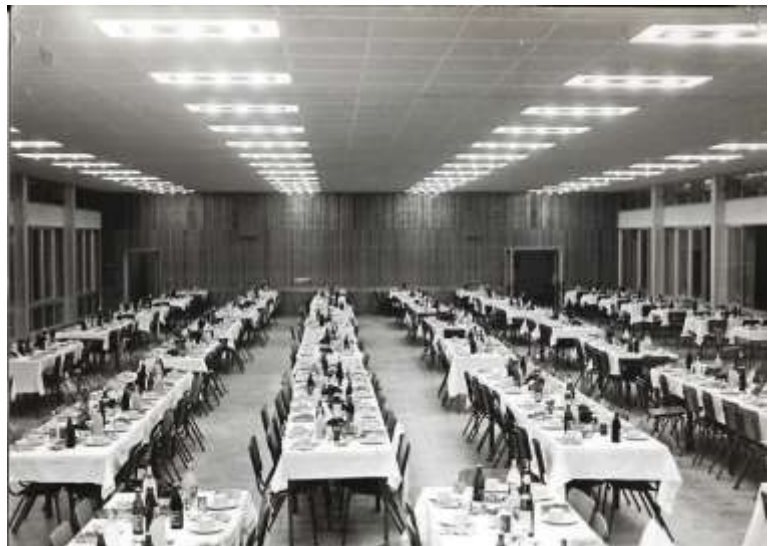
תשכ"ד, 1964. חנוכת החדר האוכל הגדול. כיום מבנה הכולבו.