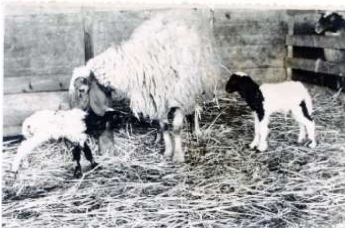
שנות השישים, דיר סעד.