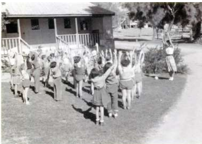
תשכ"א, 1961. שיעור התעמלות לילדים, על יד הצריף, 'בית כנסת חטיבה'.