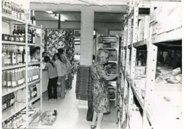
תש"ה, 1975, הכלבו בימיו הראשונים שכן במקום נו נמצאת היום המחלבה.