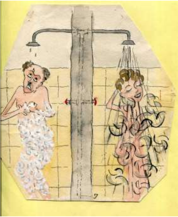
קריקטורה של פיפקה בעלון הקיבוץ מתאריך כ' בטבת תשכ"ה (1965) על המקלחת הציבורית המשותפת.