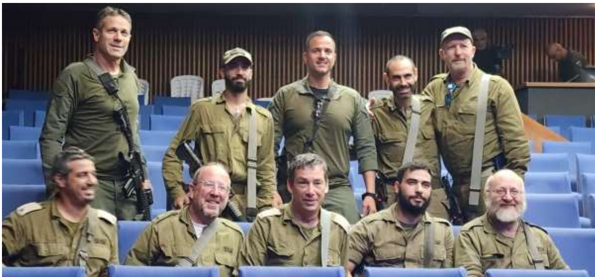
ערב הוקרה בשדרות לאנשי כוח אבשלום.