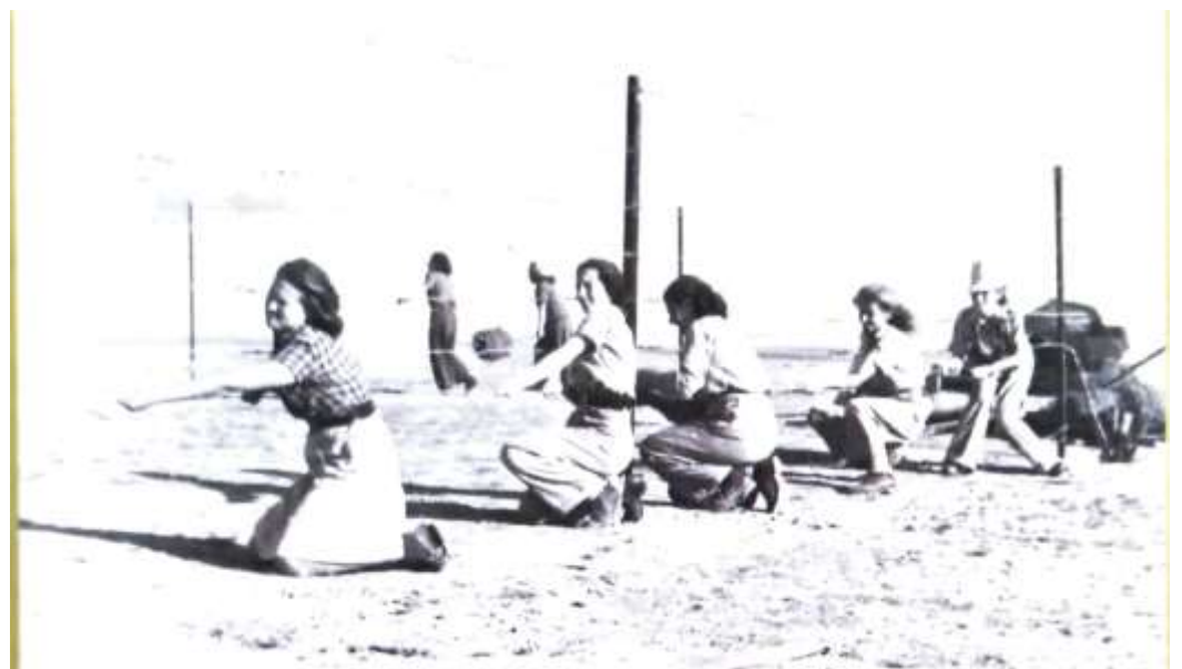
תמונות מיום העליה.